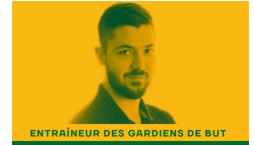
ENTRAÎNEUR DES GARDIENS DE BUT