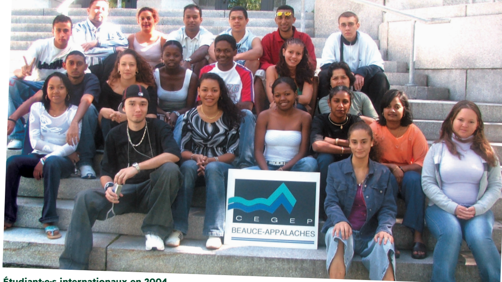
Étudiant-e-s internationaux en 2004