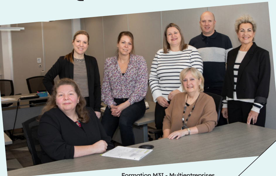
Formation M3I - Multientreprises