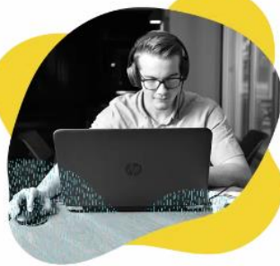
J'UTILISE LES OUTILS INFORMATIQUES