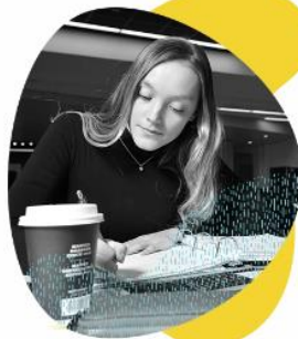
J'UTILISE DES STRATÉGIES D'ÉTUDE