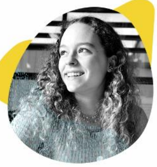
JE ME MOTIVE