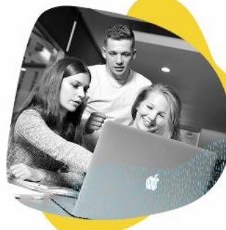
JE TRAVAILLE EN ÉQUIPE