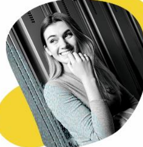
JE GÈRE MON STRESS