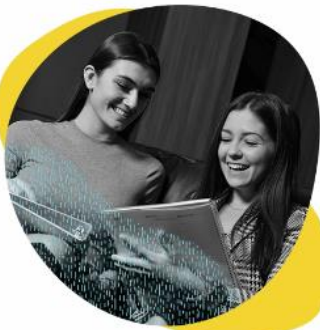
JE GÈRE MON TEMPS