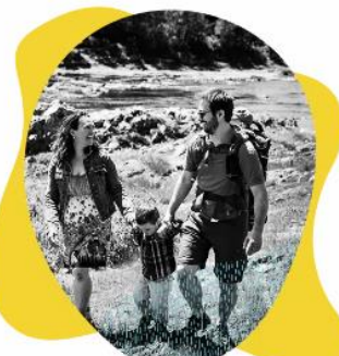
LA VIE HORS CAMPUS